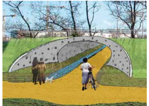
Impressie van de fietstunnel onder de nieuwe verbindingsweg.

De 500 meter lange Valentin Vaerwyckweg wordt een vlotte schakel tussen de R4 en de parkeergarage (zie nieuwsbrief 6, januari 2009). De eerste fase, de weg zelf, is zonder weerverlet klaar tegen maart 2010. Daarna begint de aanleg van de nieuwe rotonde, die voor een aansluiting met de R4 zal zorgen. Tijdens deze werken (mei tot augustus 2010) zal de verbinding met de E40 en Flanders Expo onderbroken zijn. Het verkeer zal tijdelijk een omleiding moeten volgen. In september 2010 zullen de eerste auto's de Valentin Vaerwyckweg inrijden. Op dat moment wordt de bestaande op- en afrit naar de Hogeschool opgebroken en treedt de nieuwe in werking. Bart Crombez (Agentschap Wegen en Verkeer): "Samen met de huidige wegwerkzaamheden bouwen we ook een fietstunnel, onder de Valentin Vaerwyckweg. Wie van de R4 naar het station fietst, kan zo veilig het tweerichtingsfietspad bereiken. Dat fietspad is van de weg gescheiden door een geluidswand."