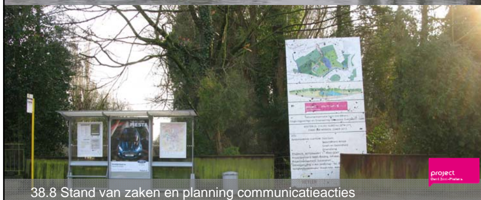
38.8 Stand van zaken en planning communicatieacties