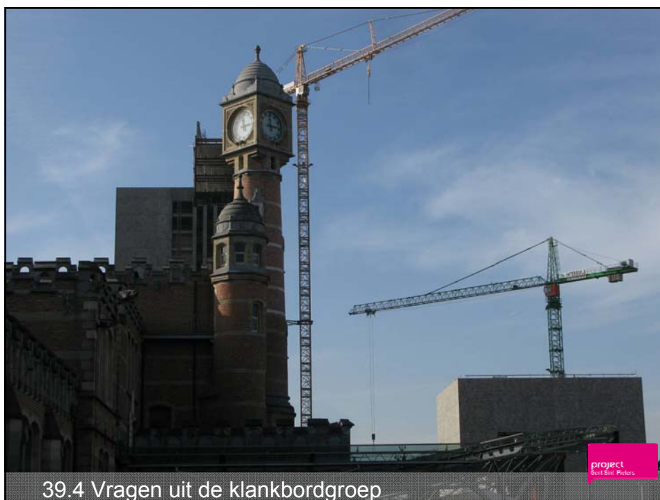
39.4 Vragen uit de klankbordgroep