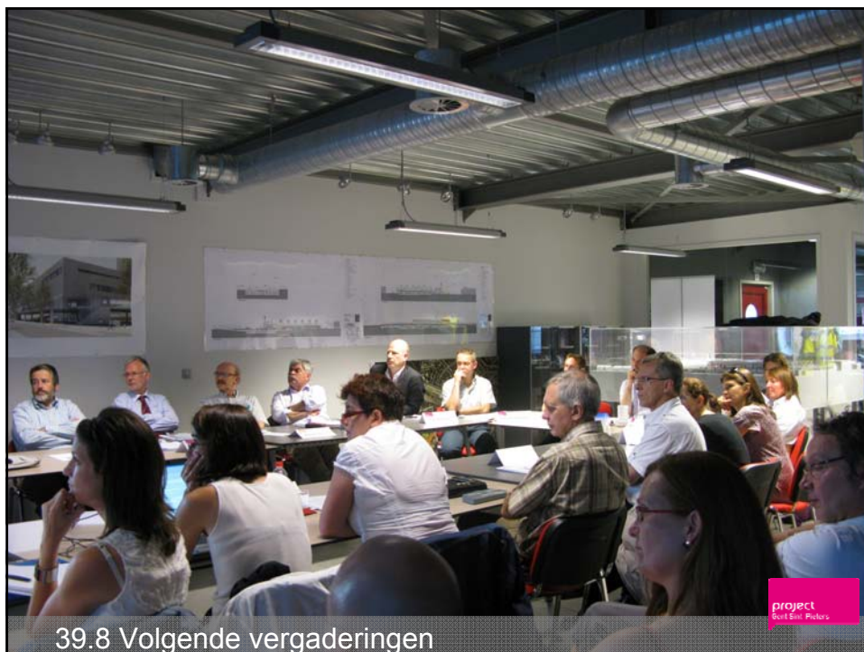
39.8 Volgende vergaderingen